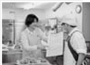
施設で出すメニューを現場の調理師と打ち合わせ

高齢者や障がいのある方を対象とした福祉施設（特別養護老人ホームや障がい者支援施設など）に勤務し、施設や地域で生活する高齢者や障がい者が自立して快適な生活を過ごすことができるよう、一人ひとりの生活状況、身体の状況に応じた食事の提供と栄養管理を行います。高齢者や障がいのある方は、身体の機能が低下することによって、食べ物が食べにくく、飲み込みづらいことがあるため、少ない量でも適切な栄養が摂れるように献立を工夫することも重要です。介護スタッフらと協力をして健康をサポートします。