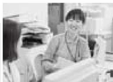
看護師と利用者さんの生活状況について共有する