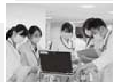
病棟で他の職種と患者さんのことを確認し、ディスカッションする