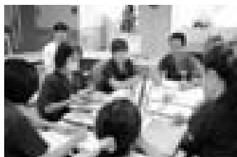
患者さんの栄養状態等を看護師・医師などとカンファランス