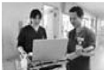
看護師と食事摂取状況や様態について情報共有をする