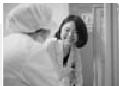
患者さんの食事を配膳前に調理者と最終チェック